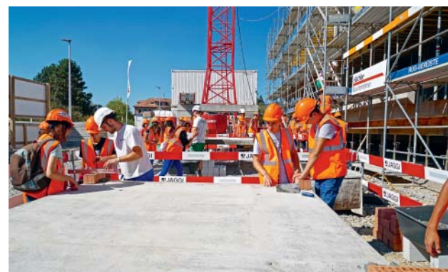
Mauern auf der Grossbaustelle.