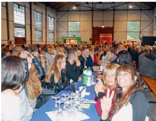
Gute Stimmung an unserem Sommerfest.

Seit 28 Jahren organisiert die Hächler-Gruppe ein grosses Fest für alle Mitarbeiterinnen und Mitarbeiter. Das Fest fand immer auf unserem Werkhof am Hauptsitz in Wettingen statt. Höchste Zeit also für eine Veränderung. Erstmals in diesem Jahr gingen wir extern und feierten in der Alten Schmiede in Baden.