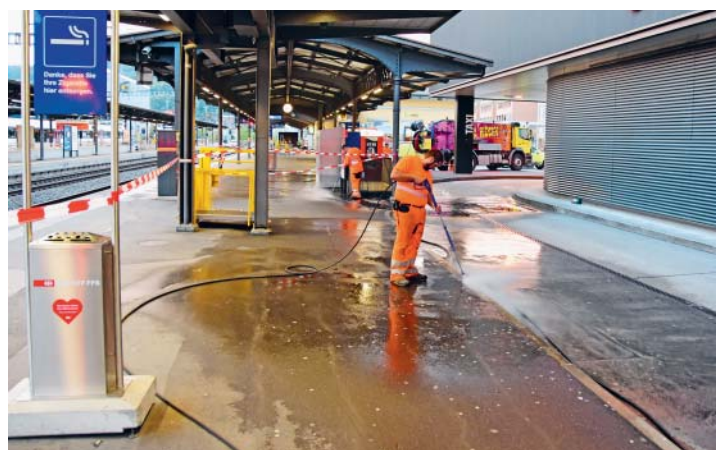
Kaugummi- und Extremschmutzentfernung.

Einen enorm verschmutzten Boden durch Kaugummi, Energydrinks und anderen Ursachen gab es am Bahnhof Baden. So wurde die Franz Pfister AG von der SBB engagiert. Während fünf Nächten reinigten wir den Boden beim Gleis 1. Nach der Reinigung erstrahlt die gesamte Fläche in neuem Glanz.