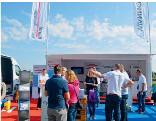
Wanner AG und Kanal total an der Gewerbeschau Dielsdorf.

Ende September fand die Gewerbeschau Dielsdorf statt. Unsere beiden Firmen Wanner AG und Kanal total (Hächler-Reutlinger AG) präsentierten sich mit einem Gemeinschaftsstand. Während prächtigen vier Tagen waren unsere Fachleute vor Ort.