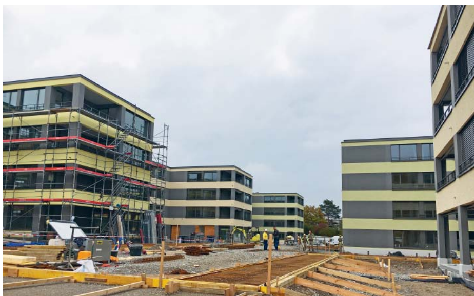
Teilansicht der fast fertigen Überbauung.