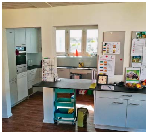
Küche: Foto links vor dem Umbau, Foto rechts: nach dem Umbau mit zeitgemässen Farben, mehr Raum und Ablageflächen.