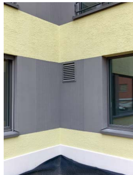
Die diversen Strukturen und Farben im Detail.