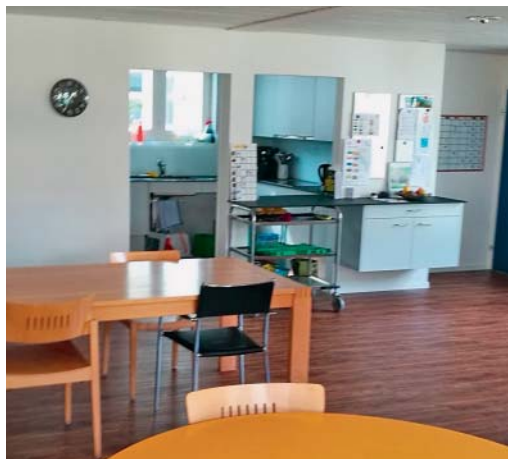
Blick vom Essraum in die Küche: Foto links vor dem Umbau, Foto rechts danach.