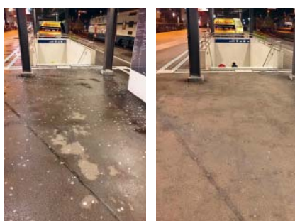
Vor der Reinigung (links) und danach.

Seit einem halben Jahr setzen wir bei der Franz Pfister AG für die Entfernung von Kaugummis und Extremschmutz ein spezielles Verfahren ein. Kein anderes Unternehmen in der Region arbeitet mit dieser Technik. Häufig werden Kaugummis einzeln mit Eisspray besprüht und abgekratzt. So entstehen Negativ-Flecken. Mit unserer Methode entstehen gar keine solchen Rückstände.